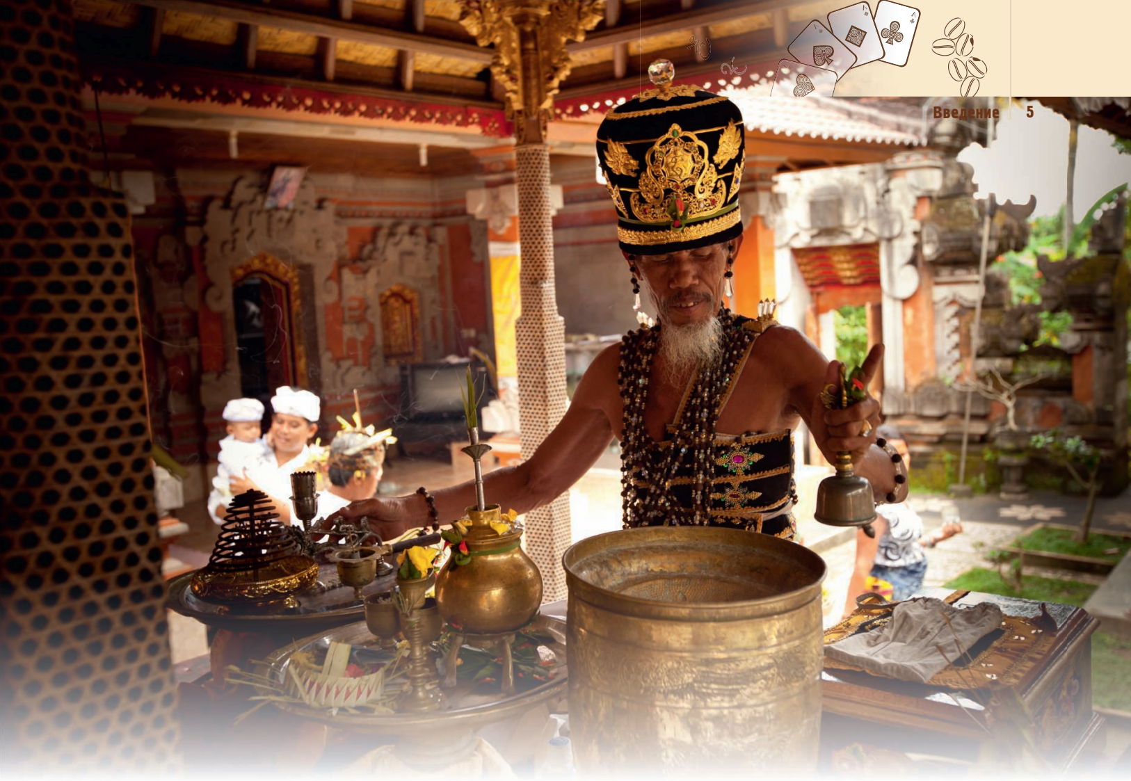
▲ Индонезийский жрец за «работой»

руны родом из Скандинавии, Книга Перемен отсылает к Древнему Китаю, гадание на кофе перенесет вас в Латинскую Америку, а карточные расклады — настолько древний способ предсказания судьбы, что даже трудно определить место его «рождения». Ознакомившись с приведенными техниками, вы сможете выбрать ту, что наиболее близка вам по духу и отвечает именно вашему видению мира.