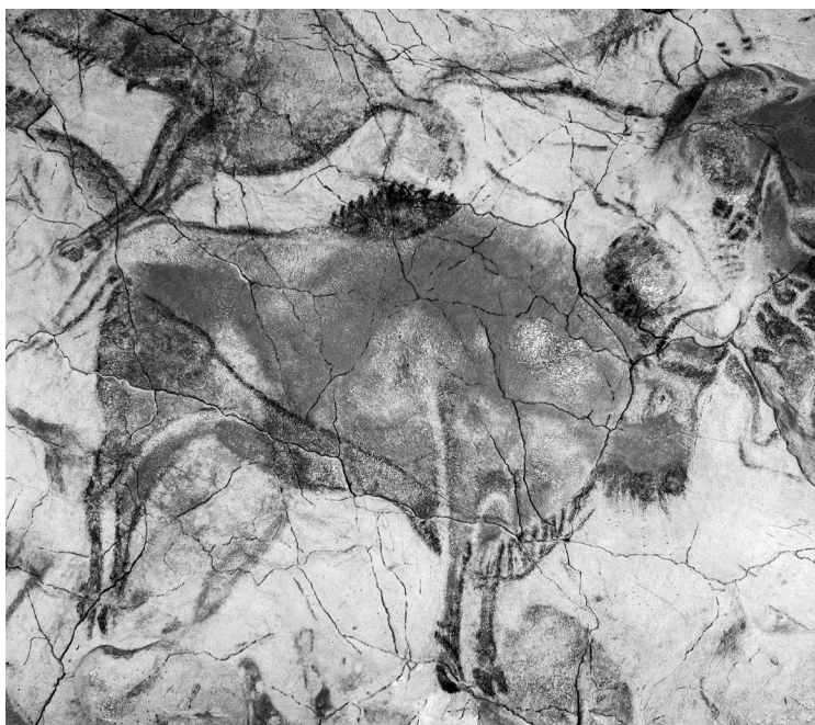
Фрагмент сцены охоты, созданной первобытным человеком в пещере Альтамира (Испания)

и сильным. Инициация могла быть разной: самостоятельно добыть на охоте хищного зверя, подвергнуться какому-то тяжелому физическому испытанию... Чаще всего инициации подвергали мальчиков, но и девочки подчас проходили через различные обряды. Какое отношение все это имеет к мифологии? Самое прямое. Человек должен был не только продемонстрировать свою «полезность» племени, но и доказать готовность существовать в окружающих его природных условиях, контактировать с высшими силами — и не ссориться с ними.