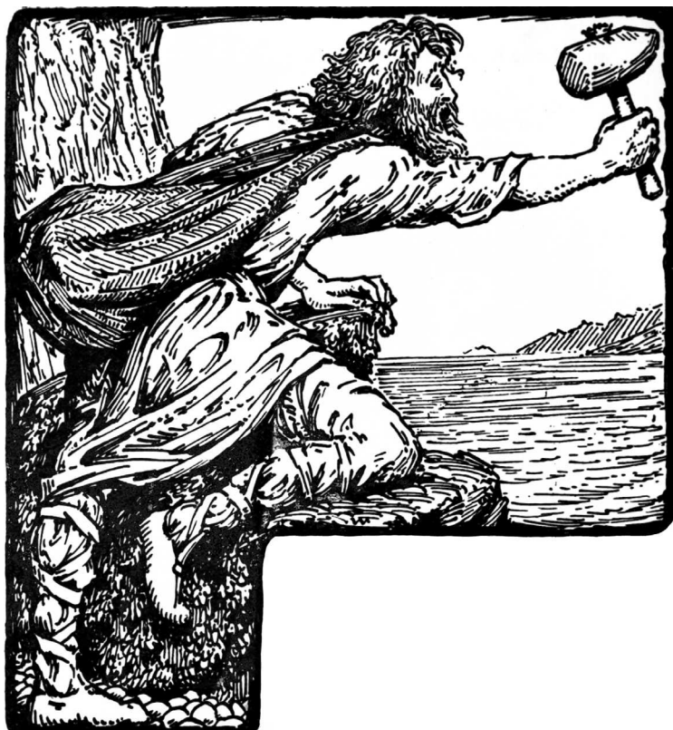
В. Коллингвуд. Книжная заставка с изображением Тора — скандинавского бога грома. 1908 г.

ряжении людей не было. И объяснения были просты: все происходящее — результат деятельности каких-то могучих существ, управляющих погодой, природными силами, а также самочувствием человека. Именно так рождался миф, представлявший собой попытку объяснить проявления окружающего мира.