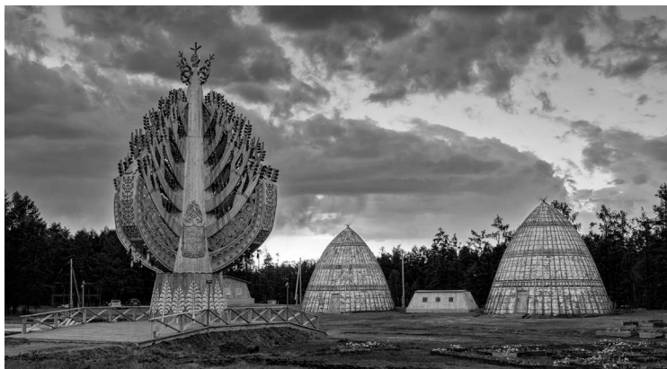
Якутская «модель» Мирового древа

Что такое миф? Каковы особенности мифологии коренных народов России, проживающих вдоль Северного Ледовитого океана и к востоку от Уральских гор? В чем разница между мифом, легендой и сказкой? Ответим на эти вопросы — и погрузимся в сюжеты, многим из которых не одна тысяча лет!