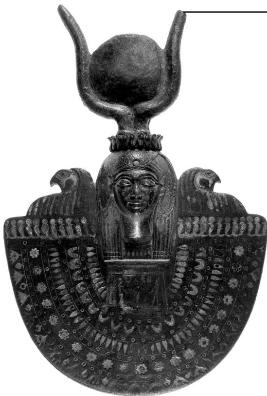
Древнеегипетское изображение богини Исида — покровительницы женщин и материнства, супруги Осириса. Ок. VII–VI вв. до н. э.

Древние боги обычно во всем похожи на представителей народа, придумавшего их. Главное отличие мифологических богов от людей — бессмертие.