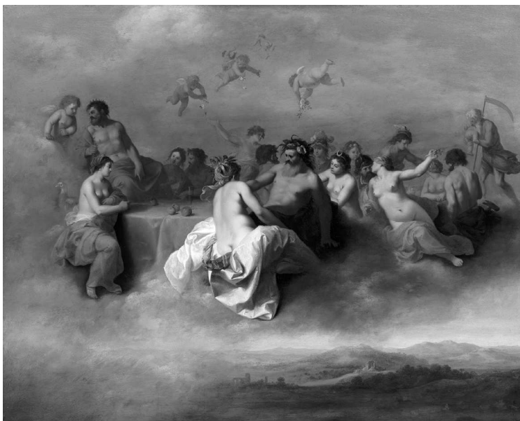
К. ван Пуленбург. Совет богов на небесах. 1630-е гг.