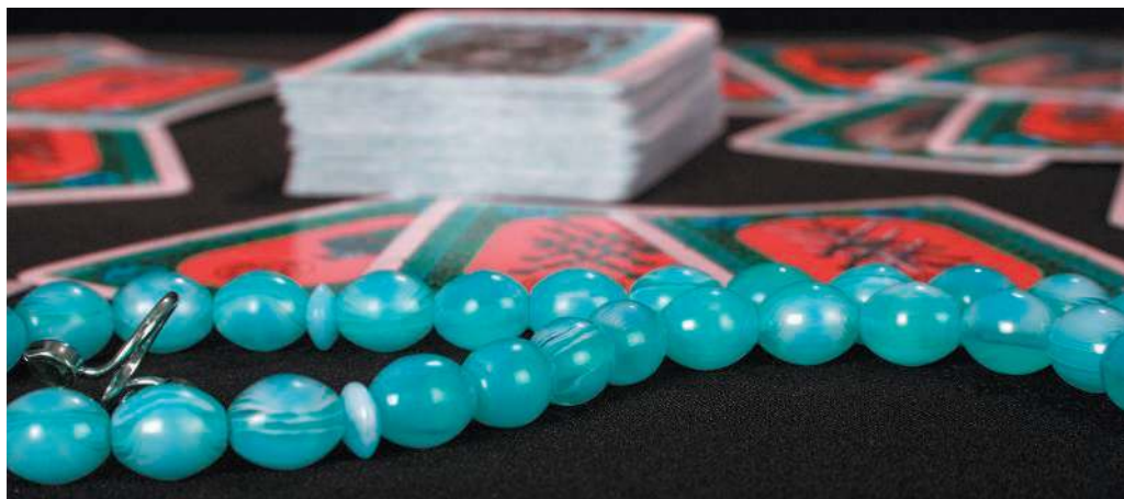
Карты требуют внимательного и бережного отношения к себе, не пренебрегайте ими

Приведенные рекомендации не являются железными правилами. Вы вольны придерживаться лишь некоторых из них, а от других отказаться. В процессе общения с картами у вас могут выработаться собственные традиции. Пренебрегать всеми рекомендациями, однако, не стоит, поскольку они возникли не на пустом месте, а формировались столетиями.