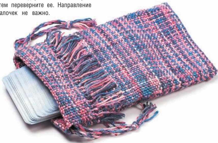
Холщовый мешочек для хранения колоды

Обращайте внимание на каждую деталь. Ничто не происходит случайно. Если в процессе тасования из колоды выпала карта, обратите на нее внимание, прочтите толкование. Это может быть часть предсказания, которая указывает на скрытые причины чего-либо, дает пояснение к раскладу. Если ваше внимание привлекла одна из карт в колоде, также обязательно прочтите толкование. Слушайте свой внутренний голос и доверяйте интуиции.